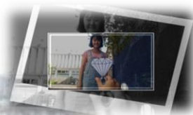
才發現你才是我最需要的那個人。