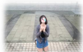
我們的關係從此變了調。