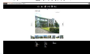
圖五、各個大樓介紹