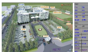
圖二、引導式地圖頁面