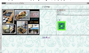
圖四、各個美食介紹