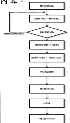
表3-4 首頁最常見版型 圖3-3 購物流程圖