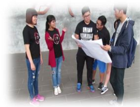
學長姐熱烈歡迎新生