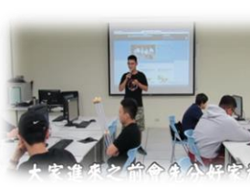
大家進來之前會先介紹家庭