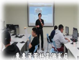
東專資訊科是個家庭