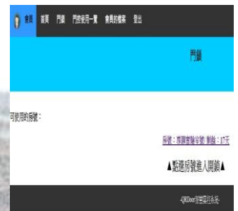
圖四、專題軟體成果畫面